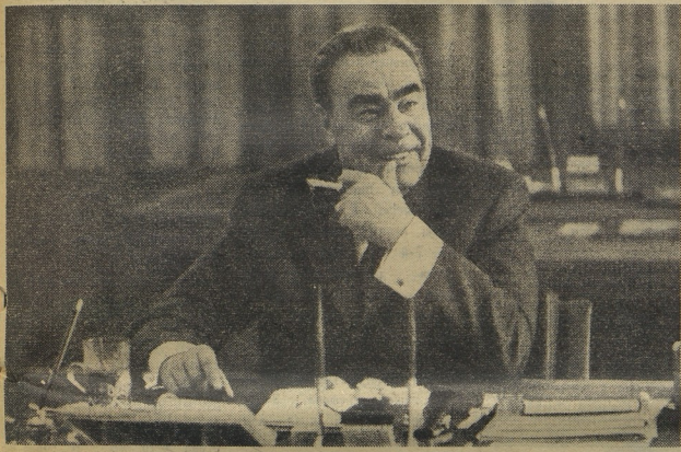
В Москве на заводе имени Лихачёва и в Днепропетровске на днях был показан новый цветной документальный фильм «Повесть о коммунисте». Картина создана на Центральной студии документальных фильмов. Это яркий кинорассказ о жизни Генерального секретаря Центрального Комитета Коммунистической партии Советского Союза Леонида Ильича Брежнева, которому 19 декабря исполняется 70 лет.

Указом Президиума Верховного Совета СССР городу Туле присвоено почетное звание «Город-герой». Мужество и стойкость защитников Тулы, проявленные при обороне, сыграли важную роль в разгроме немецко-фашистских войск под Москвой.