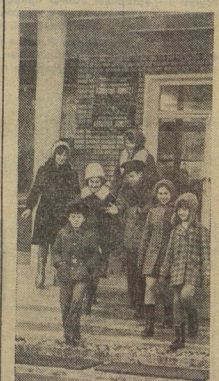
ДРУЖИНУ ЗНАЮТ В РАЙОНЕ КОМСОМОЛА. Совет дружины 31-й школы был приглашен на пленум райкома ВЛКСМ по работе пионерского актива.

ДРУЖИНУ ЗНАЕТ ВСЯ ГОРОД. Выступает агитбригада — говорит о дружине. Агитбригада школы победила на слёте во Дворце железнодорожников. Ребята выступают на городских сценках. И без сценки в полках — на полевых станах, на заводах — в цехах.