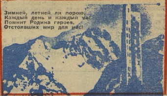
Зимней, летней ли порою... Каждый день и каждый Помнит Родина героев, Отстоявших мир для нас!