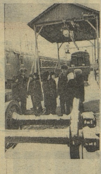
ДРУЖИНУ ЗНАЮТ В ХАНОЕ. Пионеры помогают зарубежным ровесникам. На трудовые субботники выходят все участвуя в пионерской организации «Миллион» — Родине! дружина собрала 22 тонны мануфактуры, в два раза больше, чем намечали. Опять победители!

ДРУЖИНУ ЗНАЮТ В ВАГОННОМ ДЕПО НА ОРЛОВСКОМ ЖЕЛЕЗНОДОРОЖНОМ УЗЛЕ. На проходной открывают широкие ворота — идёт пионерский отряд. «Наши идут!» говорит рабочий. Если бы «А» значил в механический, если 5-й «А» — в валярный У шёфов в цехах проходит аграрные сборы.